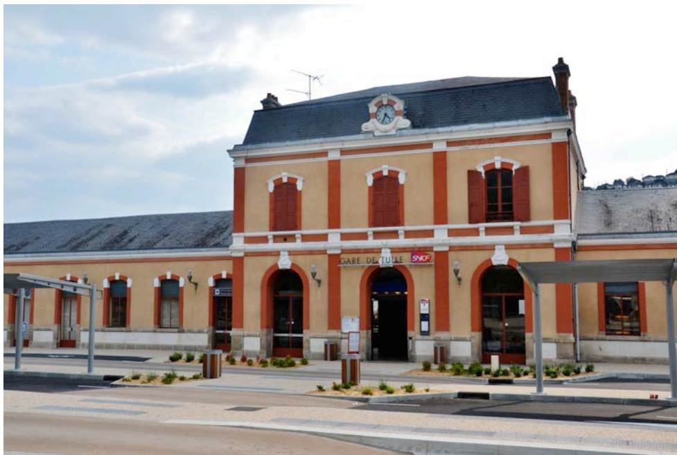
Gare ferroviaire de Tulle par Babsy

Appliquant la méthode paranoïaque-critique de Salvador Dali qui considérait la gare de Perpignan comme le centre du monde, François Hollande, le bon président bien-aimé, pareil au chantre du surréalisme publicitaire, pourrait lui aussi chanter l'ode à la gare de Tulle dont les tullistes et tulloises lui sont si redevables : "C'est toujours à la gare de Tulle [...] que me viennent les idées les plus géniales de ma vie. [...] L'arrivée à la gare de Tulle est l'occasion d'une véritable éjaculation mentale qui atteint alors sa plus grande et sublime hauteur spéculative. [...] Eh bien, j'ai eu à la gare de Tulle une espèce d'extase cosmogonique plus forte que les précédentes. J'ai eu une vision exacte de la constitution de l'univers. L'univers, qui est l'une des choses les plus limitées qui existe, serait, toutes proportions gardées, semblable par sa structure à la gare de Tulle."