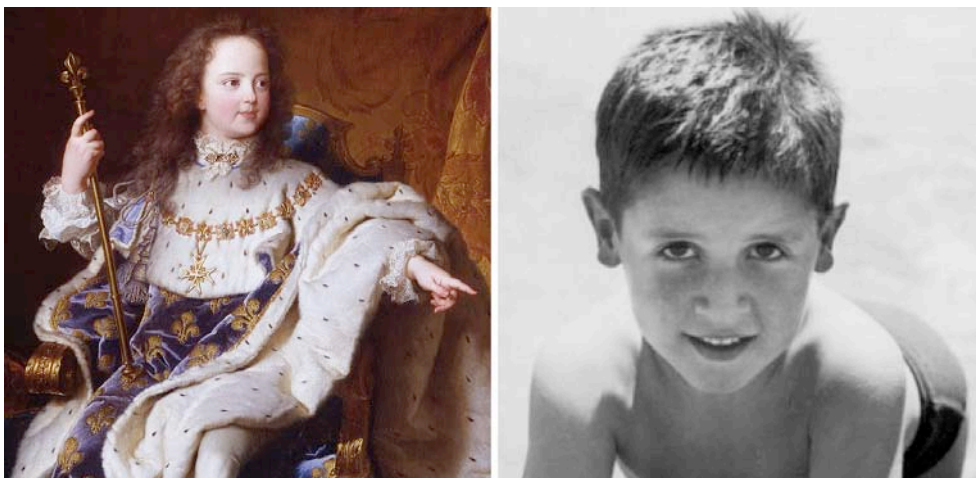
Louis XV âgé de 5 ans sur le trône de France et François Hollande âgé de 6 ans à la plage détail de Louis XV en costume de sacre par Hyacinthe Rigaud, 1715

Tel Louis XV et Charles VI de France, tous deux surnommés " le Bien-Aimé ", tel Philippe III de Bourgogne, dit " Philippe le Bon " et René d'Anjou, dit " le Bon Roi René ", François Hollande, président de la République française, est lui aussi apprécié non plus de ses sujets et sujettes... mais citoyens et sans-culottes. Face à pareil amour et gentillesse, les mauvais sondages ne sont que peu de chose, quelques gouttes de médisance et désespoir dans un océan de félicité dont les vagues azurées certes se brisent sur des rivages en crise, mais néanmoins remplis d'espérance.